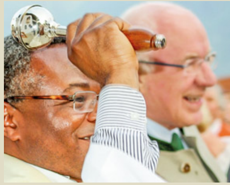
Segnung des Gemeindeplatzes.