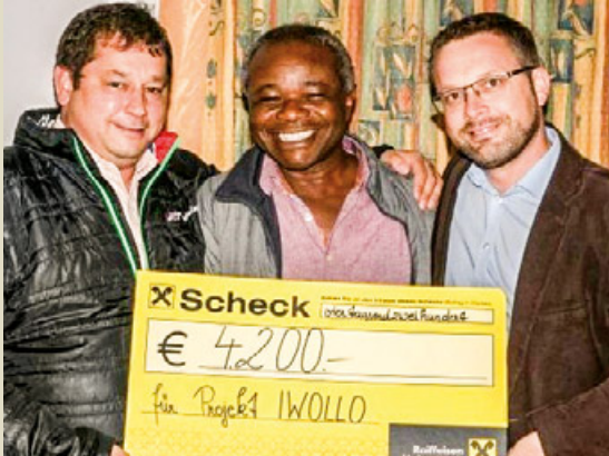
Spende für Iwollo.