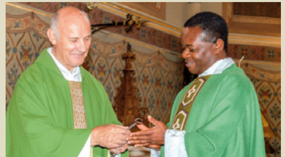
Pfarreinstand Paulinus 2009.