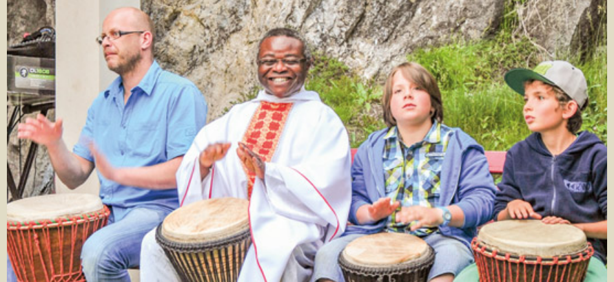
Trommeln am Locherboden.