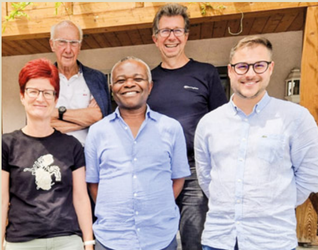
Das Pfarrteam 2024.