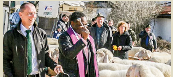
Paulinus bei der Schafsegnung.