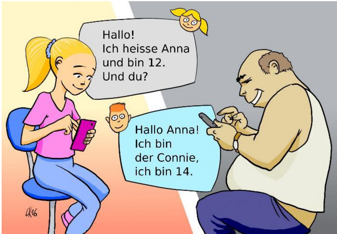
Illustration: Christoph Kaindel für Saferinternet.at, lizenziert unter CC BY-NC 3.0 AT