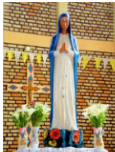
Gottesmutter von Kibeho