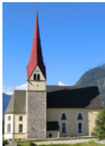
Eben am Achensee