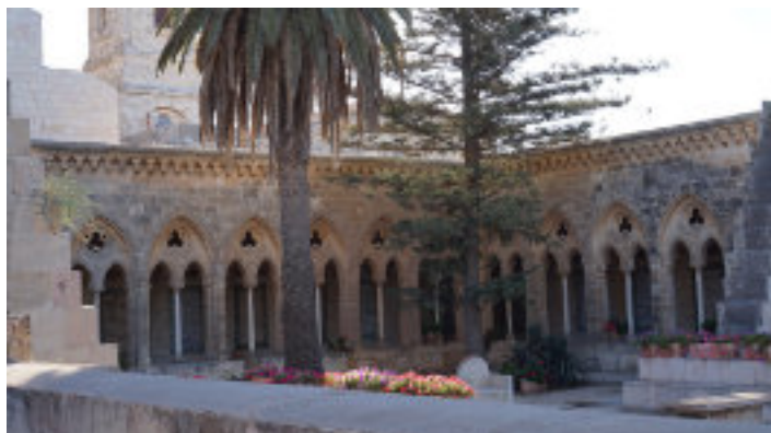
Vaterunserkirche auf dem Ölberg

Ja, unzählige Male haben wir das Vaterunser gebetet, gesungen, geplappert oder auch nur gemurmelt. Aber ist uns auch bewusst, dass es sich dabei um den kostbarsten Gebetstext der ganzen Christenheit handelt? Es lohnt sich, dieses Vaterunser einmal genauer in den Blick zu nehmen, denn es ist einmalig!