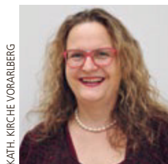
KATH. KIRCHE VORARLBERG

Die Basissicherung als erste Säule wird ergänzt durch eine sozialpartnerschaftlich regulierte zweite Säule. Während allfälliger Unterbrechungen der Erwerbsbiographie werden weiterhin Beiträge geleistet beziehungsweise Rentenansprüche erworben.