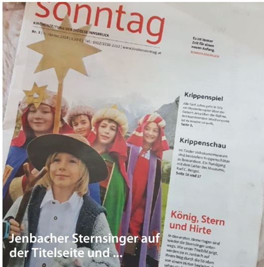
Jenbacher Sternsinger auf der Titelseite und ...

der Zugang zu Trinkwasser und Bildung nicht für alle Menschen so selbstverständlich ist wie bei uns. Wir freuen uns über das großartige Spendenergebnis aus unserem Seelsorgeraum und danken allen für die Unterstützung.