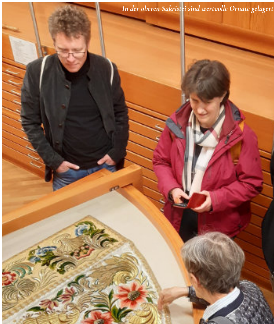
In der oberen Sakristei sind wertvolle Ornate gelagert