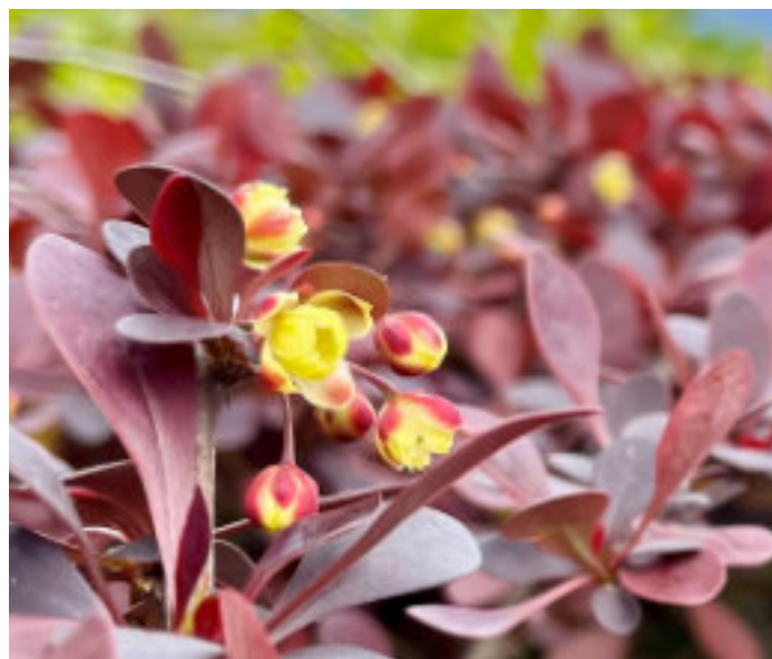
"Zungen wie von Feuer" (Apg 2,3)