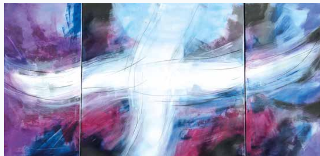
Künstler: Wolfgang Kapfhammer

Worte des Lebens hast Du ausgehaucht im Sterben am Kreuz.