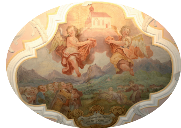
„Damit nit einmal die Pestilenz über uns komme.“ Im Hintergrund begraben die Höttinger die Pesttoten. In der Waldwildnis die Kapelle.

Am 21. August 1625 wird das Kirchlein eingeweiht. Aber die Pest tobt weiter. Nur zehn Personen überleben die todbringende Seuche in der Parzelle Höttinger Ried. Man verspricht eine Wallfahrt zum Kirchlein. Und endlich „erbarnt sich die göttliche Mutter“ – so die Chronik – und die Pest erlischt.