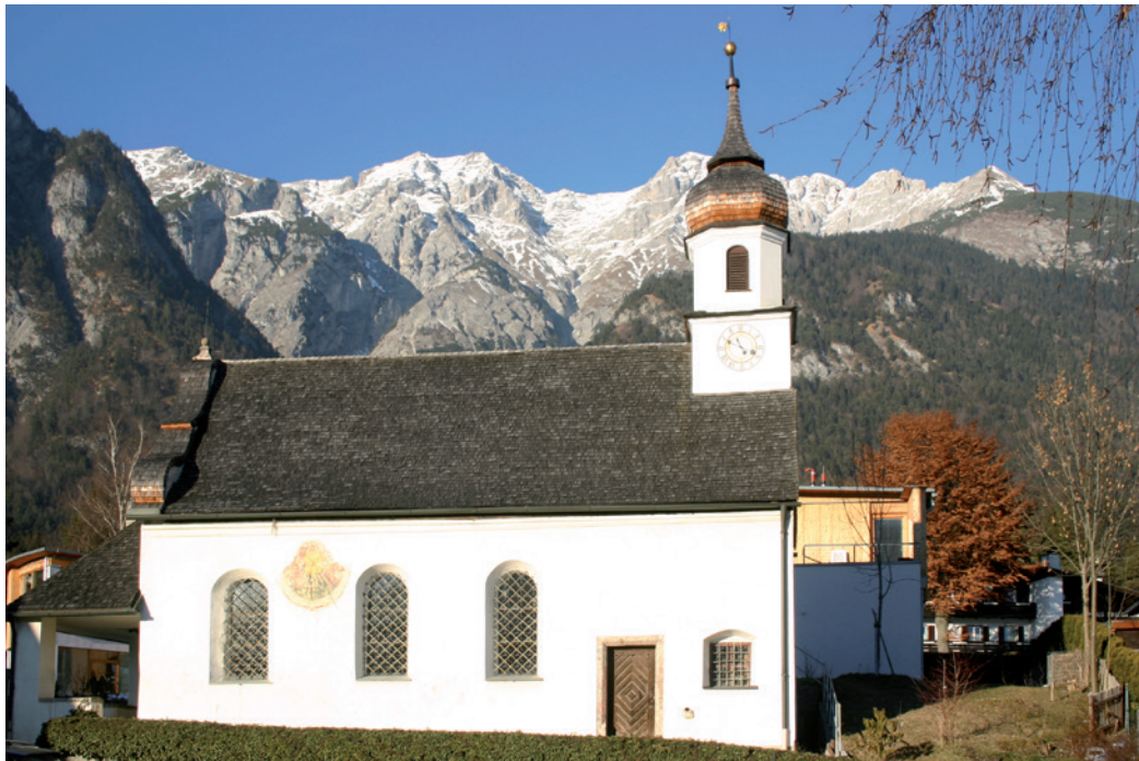
400 Jahre: 1621 wurde erstmals das Patrozinium „Maria Heimsuchung“ genannt.

Durchstarten – nach einer Pandemie. Diese Intention hatte offenbar auch der Besitzer des Kranebitter Hofes.